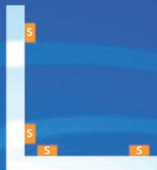
Mietfachblock in L-Form Vier Sensoren zur Überwachung