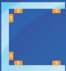
Mietfachblock in U-Form Sechs Sensoren zur Überwachung

Für weitere Informationen und Konfigurationen kontaktieren Sie uns unter info@contecon.de .